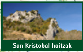
San Kristobal haitzak