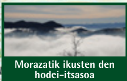
Morazatik ikusten den hodei-itsasoa