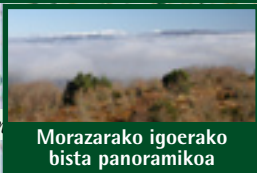
Morazarako igoerako bista panoramikoa