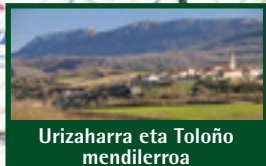
Urizarra eta Toloño mendilerroa