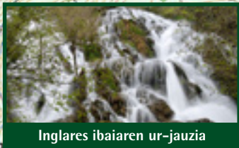
Inglares ibaiaren ur-jauzia