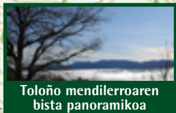
Toloño mendilerroaren bista panoramikoa