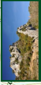
Peñas de San Cristóbal