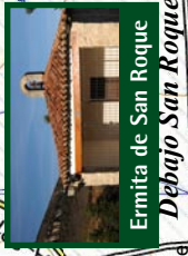
Ermita de San Roque Debajo San Roque