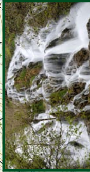
Cascada del río Inglares