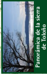
Panorámica de la sierra de Toloño