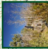
Descenso del Moraza