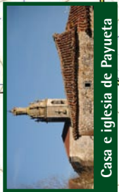
Casa e iglesia de Payueta